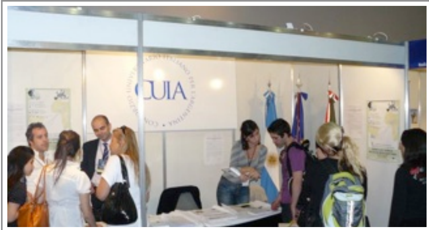
Stand del CUIA alla Expo Universidad 2010

L'ExpoUniversidad 2010 si è tenuta nella città di Buenos Aires, nel Predio Ferial de La Rural, padiglione Odra, dal 20 al 24 ottobre. La fiera universitaria è considerata l'evento più importante dell'educazione superiore in America Latina. Il Consorzio ha deciso di partecipare all'iniziativa con un proprio stand (n° 312), presente nel padiglione internazionale della Fiera dedicato ai corsi post-laurea quali Master e PhD. Il giorno 22 ottobre si è inaugurato lo stand CUIA, ricevendo molti studenti interessati a proseguire o a svolgere un periodo di studio in Italia. I giorni 23 e 24 ottobre, si è rilevata la presenza di studenti, dottori di ricerca e ricercatori interessati a seguire un corso di dottorato di ricerca e a promuovere ricerche in ambito scientifico in collaborazione con studiosi italiani.