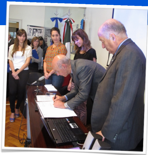
Cerimonia di firma degli accordi istituzionali

Link: http://www.jgm.gov.ar/paginas.dhtml?pagina=744