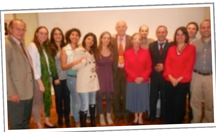
Ceremonia de cierre del Curso EURAL

Visualizza la Giornata istituzionale tramite Bairesuno TV