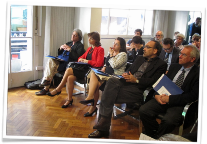
Autoridades presentes en la Jornada institucional del 22 de abril 2013