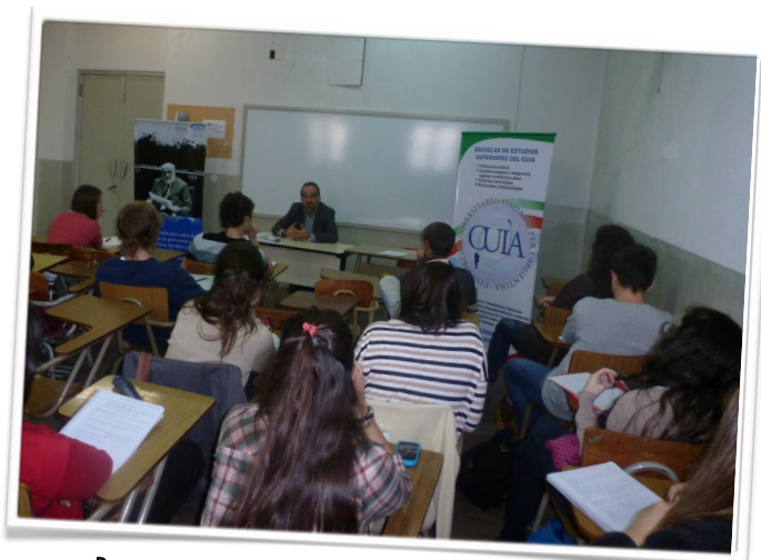
Presentación de la Cátedra Spinelli del CUIA