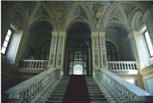
Palazzo Ateneo - Salone degli Affreschi

11-12 OTTOBRE 2018 · BARI UNIVERSITÀ DEGLI STUDI DI BARI "A. MORO"