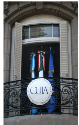
Sede CUIA a Buenos Aires

Naturalmente non sono inclusi in questo contesto laureandi e giovani studiosi italiani che si trovano nelle università argentine in diverse fasi del loro percorso formativo; cui si aggiungono le molto numerose presenze di professori e ricercatori italiani