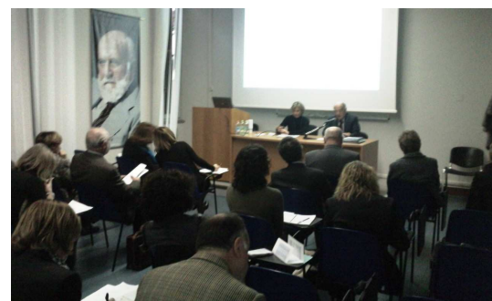
aula Spinelli, sede di Roma

Il prossimo Consiglio Direttivo si terrà il 12 marzo 2010, dalle ore 11.00 alle ore 14.00 presso la sede di Roma.