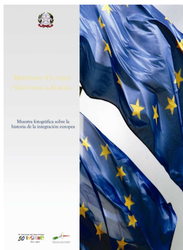
Mostra "Linea 13: da Ventotene all'Europa", mostra fotografica sulla storia dell'integrazione europea